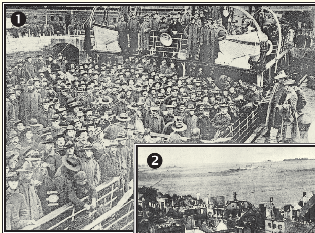
1 Llegada de tropas australianas a Plymouth. 2 Aspecto de la ciudad de Gerdauen, bombardeada por el ejército ruso. 3 Tropas senegalesas en marcha. 4 Campamento de australianos junto a las pirámides de Egipto.